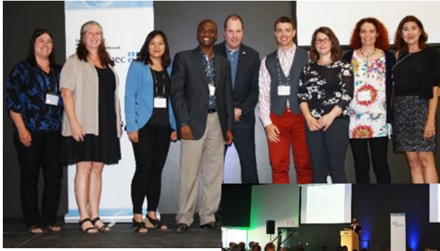
Quelques membres du comité organisateur de l'événement