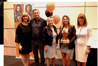
Étoiles de campagne