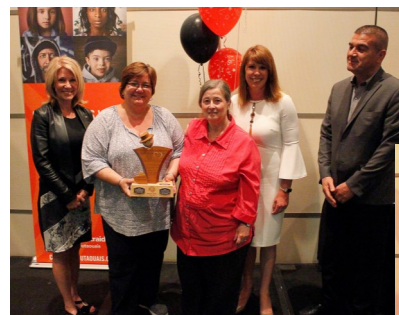
catégorie Santé et services sociaux

En tout et partout en Outaouais, les différentes initiatives ont permis de recueillir 4 535 787 $.