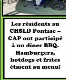
Les résidents au CHSLD Pontiac – CAP ont participé à un dîner BBQ. Hamburgers, hotdogs et frites étaient au menu!