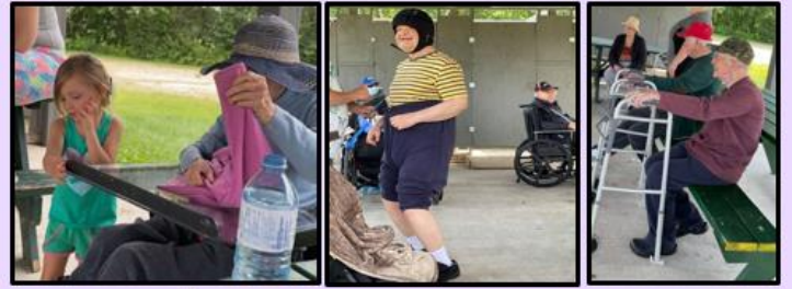
Les Résidents du CHSLD Pontiac « Manoir Sacré Cœur » ont profité de la belle journée et d'un bon dîner en pique-nique au parc.